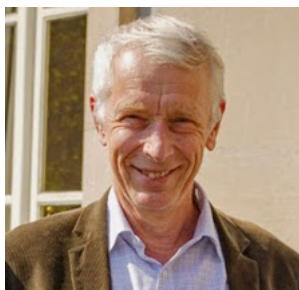
Le nouvel ouvrage de Marc Ronvaux est disponible aux éditions Martagon.

Cette fois, c'est une centaine – 111 précisément, 111 chiffre magique – de faits, de portraits, de focus étonnants et souvent méconnus qu'il nous raconte. L'auteur balaye vingt siècles d'histoire de la province en picorant ci et là, extrayant de ses multiples recherches une sélection de pépites, allant du fait divers tragique à des aspects étonnants de la vie quotidienne de nos aïeux, des rudes moments de guerre aux autres périodes plus festives ou glorieuses. Cela fait autant de courts chapitres, rassemblés dans un livre grand public, 111 curiosités de l'histoire namuroise . « Après deux recherches doctorales, j'avais envie